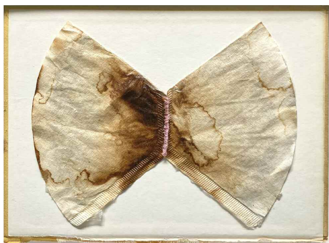
Inge van der Ven, zonder titel, koffiefilter, acrylbinder, garen op boekomslag, 26x33x4 cm, 2022

Er is een rondleiding langs de etalages op zaterdag 6 april om 17 uur ; verzamelen op het Van Limburg Stirumplein. Aansluitend is er een borrel in de buurtwerkplaats, Cliffordstraat 36.